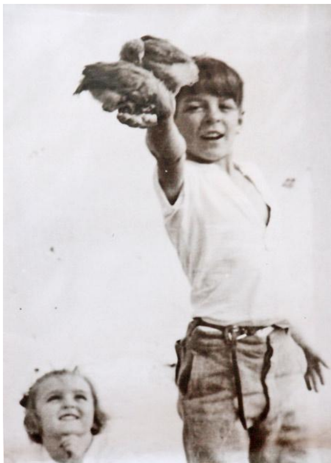
Slika 1. Mladi Ernesto 1

„Budimo realisti, zahtijevajmo nemoguće.“