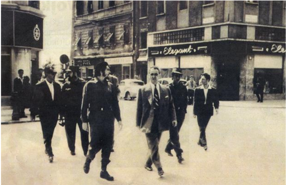
Slika 3. Che šeeće riječkim Korzom, slikao Pero Grabovac 18

Za vrijeme Cheova boravka u Jugoslaviji, 15. kolovoza 1959. u Jugoslaviju je na desetodnevni posjet stigao i etiopski car Haile Selasije, koji je u jutarnjim satima sletio na vojni aerodrom Veruda u blizini Pule, odakle je dospio u Fažanu, a iz Fažane na otok Veliki Brijun, gdje se sastao s Titom. Istog dana, Che je napustio Beograd, te je u Rijeku stigao 18. kolovoza 1959. godine. 19