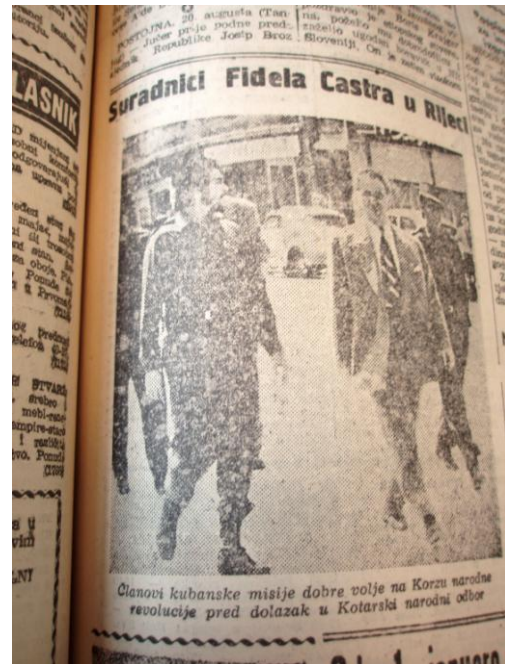
Slika 5. „Suradnici Fidela Castra“, Novi list, 21. kolovoza 1959. godine

U nastavku donosim puni tekst spomenutog članka čiji je autor Mario Barak: „Rijeka, 19. kolovoza – Danas u podne izaslanstvo dobre volje Republike Kube predvođeno iznimnom ambasadorom, bojnikom Ernestom Guevarom Serna, posjetilo je predsjednika Narodnoga odbora Rijeke, druga Edu Jardasa, s kojim su se zadržali u srdačnom razgovoru. Kubansko izaslanstvo jučer je u Opatiju pristiglo s Brijuna gdje ih je primio drug Koča Popović, savezni sekretar inozemnih poslova SFRJ. Nakon kraćeg odmora u Opatiji, izaslanstvo je jutros posjetilo brodogradilište „3. maj“ zanimajući se za proizvodne procese i proizvodne kapacitete ovoga našeg radnog kolektiva. Nakon što su primljeni u sjedištu Narodnog odbora Rijeke, predsjednik Edo Jardas ponudio je gala ručak u čast kubanskog izaslanstva u hotelu „Park“. Odmah poslije ručka izaslanstvo je napustilo naš grad i nastavilo put Ljubljane.“ 27