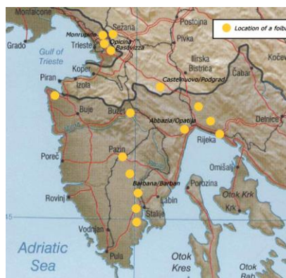
Slika 2. Mjesta "najpoznatijih" fojbi 2