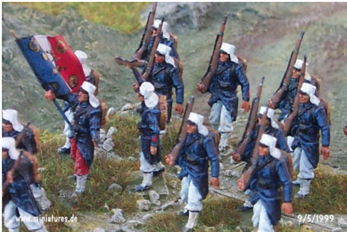
Legionari iz 1852. godine