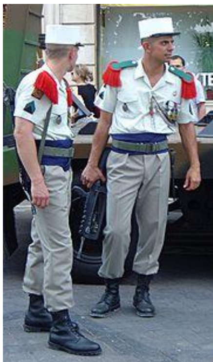
Legionari u paradnoj uniformi