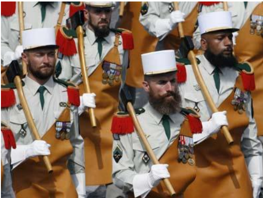
Svečana uniforma s karakterističnom „pregačom“ i keepiem