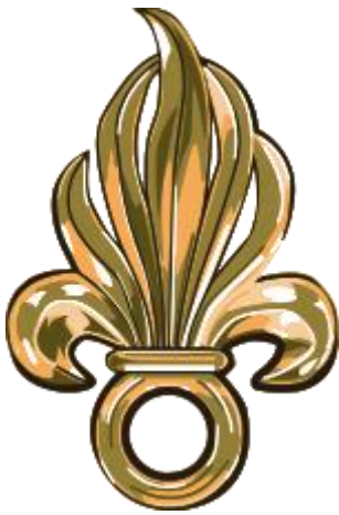
Simbol Legije stranaca- granata sa sedam vatrenih repova

Već pri samom spomenu na Legiju stranaca kod ljudi se javljaju različita mišljenja, ali najčešće ipak negativnog predznaka. Naime, nijedna vojna postrojba nije ostala tako tajanstvena i nije izazivala toliko kontroverzi oko svoje reputacije kao francuska Legija stranaca - Legion Etrangere . Slike koje se obično vežu za nju su nasilje i kriminal, ali i zavidna razina vojne spretnosti, fizičke i psihičke izdržljivosti. Što se tiče samog značenja riječi legija, ona podrazumijeva posebnu vojnu formaciju Francuske i Španjolske, no prvi puta takva vojna formacija javlja se u starom Rimu. Sastoji se od naoružanih i vojno istreniranih dobrovoljaca spremnih na vojne akcije u bilo kojem dijelu svijeta pod zastavom matične zemlje. Ona je stalni, zakonom i formacijom predviđen dio oružanih snaga. 1