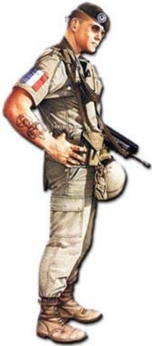
Terenska uniforma legionara