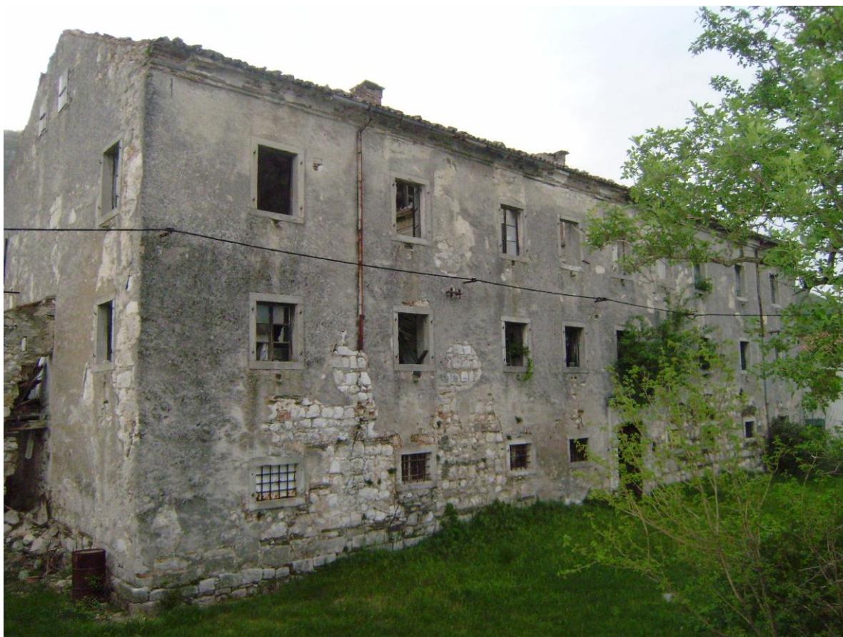
Lupoglavski kaštel iz 17. stoljeća 7

Današnje se naselje počelo razvijati oko tog kaštela u 19. stoljeću, a njegovi su ostaci sačuvani i danas lijepo uočljivi. Središnja stambena dvokatnica s prizemljem, koja je služila u gospodarske svrhe, još je u dobrome stanju te čeka ulaganje od mjesne općine. U unutrašnjosti dvokatnice nalaze se ostaci geometrijskih štukatura i opreme kućne kapele. Dvorac je utvrđen zidinama, a uz vanjsku stranu istočnog dijela zidina dozidana je štala.