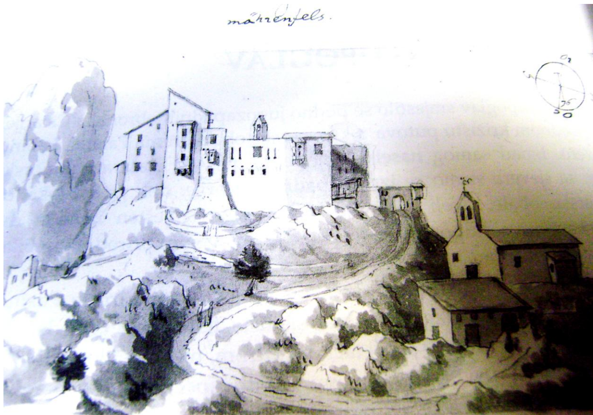
Stari lupoglavski kaštel na veduti Johanna Weikharda Valvasora iz 1679. 3

Lupoglav je nosio razna imena: na njemačkom je jeziku Mahrenfels , Merinvuels , Mernfels . Kod spomena prvih slavenskih kolonista 1100., odnosno u diplomama iz 1102., Benussi pronalazi termin castrum Mahrenfels , dok 1264. govorimo o terminu castrum Lupoglavu . Kranjski bakrorezac, izdavač i polihistor Johann Weikhard Valvasor (1641.-1693.), s kojim je surađivao Pavao Ritter Vitezović, naziv Lupoglav izvodi iz kombinacije riječi lepo i glav , što bi značilo lijepi vrh, te pretpostavlja motiviranost geografskim položajem.